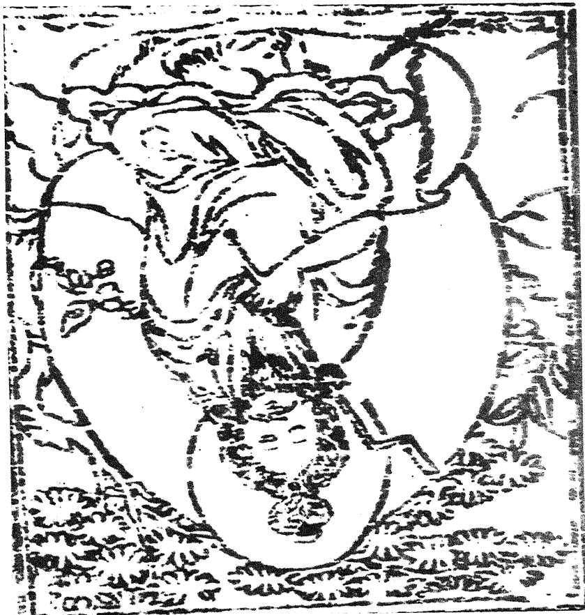
Dandin's Picture as found in a Tibetan Xylograph